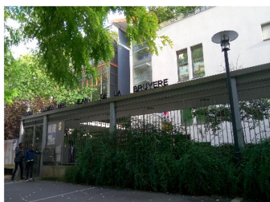
ジャン・ド・ラ・ブリュイエール小学校 Ecole élémentaire Jean de la Bruyère 8 Chemin des écoliers 92400 Courbevoie