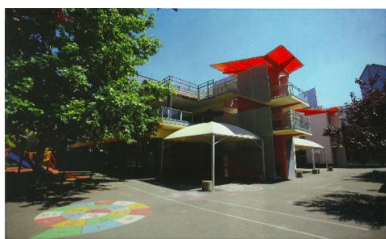
レ・フォヴェル幼稚園 Ecole maternelle Les fauvelles 6 Chemin des écoliers 92400 Courbevoie