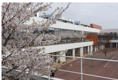
ジョルジュ・ポンピドゥー中学校 Collège Georges POMPIDOU 20 Av. Château du Loir, 92400 Courbevoie